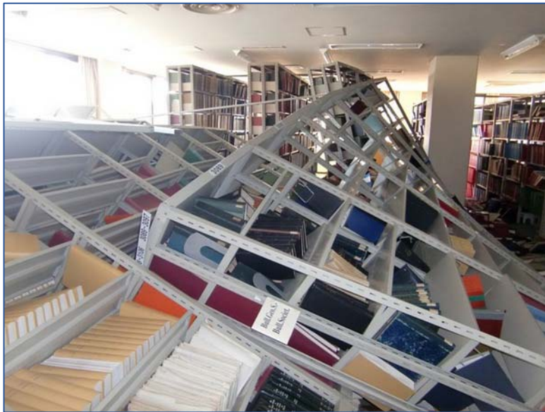
北青葉山分館3階雑誌書架