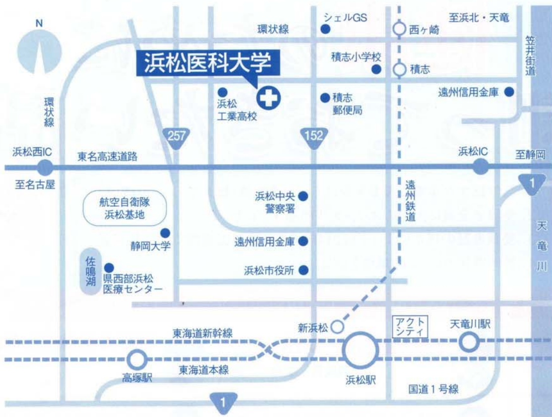
浜松駅北口バスターミナルからの交通案内