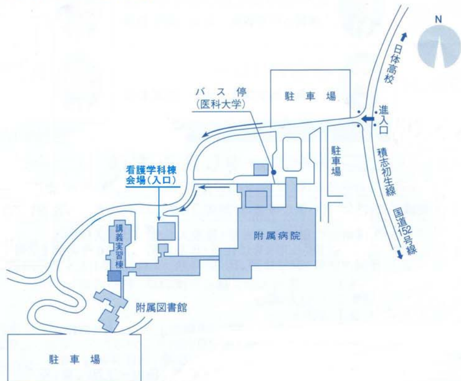
浜松医科大学案内図